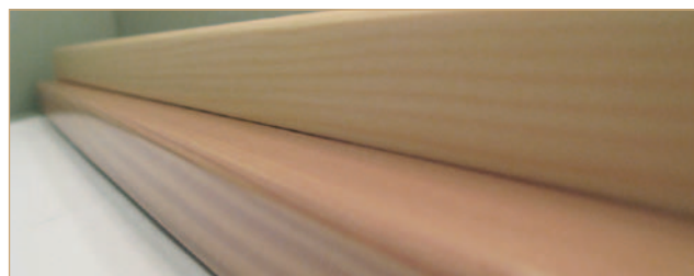
Bezbarwny system powłok uwypuklający naturalny rysunek drewna